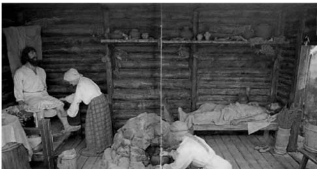
Рис. 4. Інтер'єр Давньоруська лазня (худ. А. Крижопольський, Л. Козаченко, скульп. С. Британ ( https://spadok.org.ua/znakharstvo/slov-yanska-banya-istoriya-ta-vplyv-na-zdorov-ya ))

На теренах давньої Русі масаж також мав свої традиції, які тісно пов'язувалися з банною культурою. Через суворі кліматичні умови Півночі масаж практикувався переважно в умовах парових лазень, де застосовувалися березові віники, трав'яні настої, квас і хміль (рис. 4). У 70-х роках XIX ст. масаж був фізіологічно обґрунтований, що дало змогу розробити систематизовану методику прийомів. У подальшому його застосування стало поширеним у медичних установах та косметологічній практиці [10, с. 150].