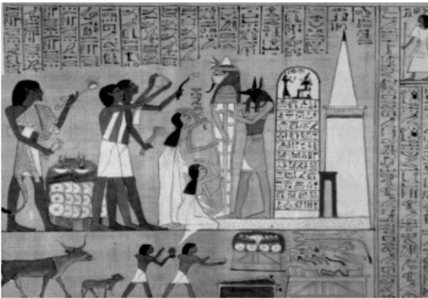
Рис. 2. Масаж в давньому Єгипті ( https://lnk.ua/DHFWp5wjQ )

Завоювання Індії арабами сприяло трансформації індійських масажних технік та їхньому зближенню з класичними підходами східної медицини. Арабська медицина, у свою чергу, перейняла численні прийоми індійського масажу. Вже у 12–15 ст. до н.е. масаж був поширеним явищем у медичній культурі Стародавнього Єгипту, Абіссинії, Нубії, Лівії та інших регіонів. Про це свідчать численні зображення на посуді, барельєфах, а також згадки в давньоєгипетських папірусах (рис. 2).